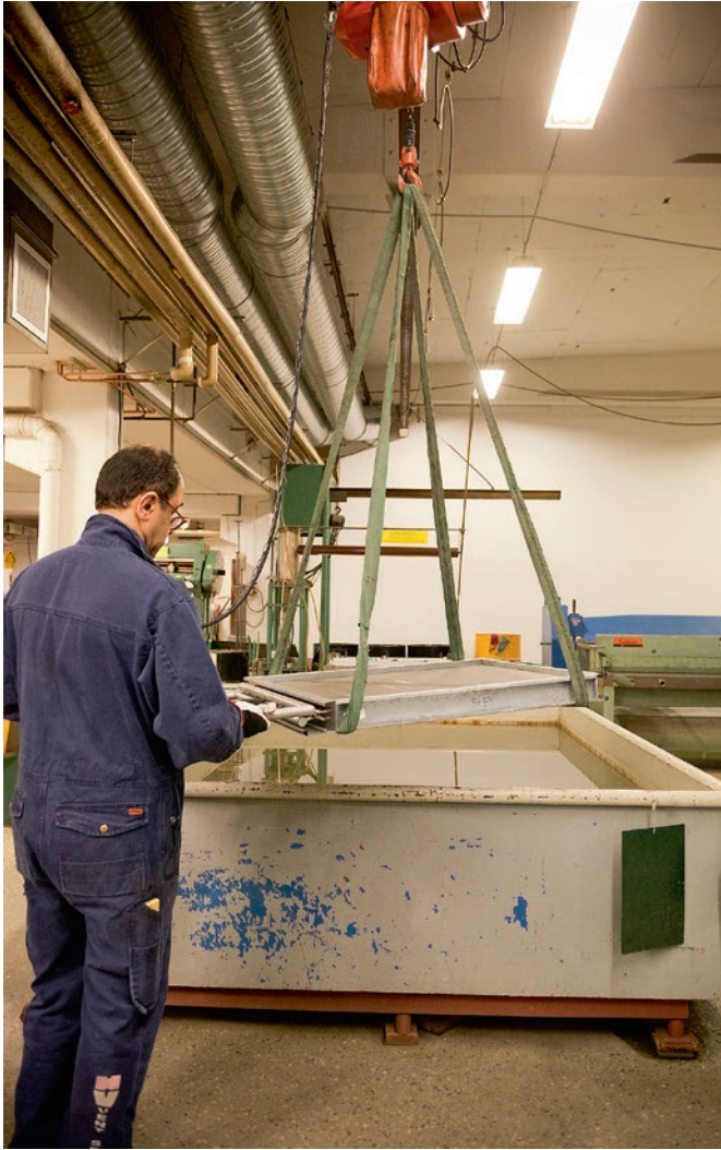
Värmeväxlarna provtrycks i vattenbad, innan leverans.

välja linje i gymnasiet. För det är ett framtidsyrke, menar han, men det måste marknadsföras bättre för att ungdomarna ska få upp ögonen för det.